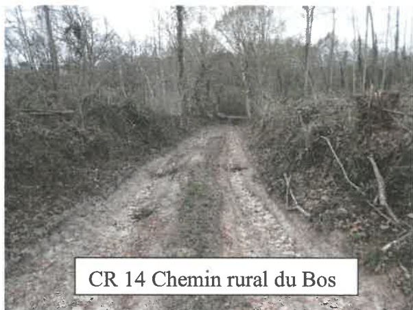
CR 14 Chemin rural du Bos

Les chemins ruraux appartiennent au domaine privé des communes et sont affectés à l'usage du public.