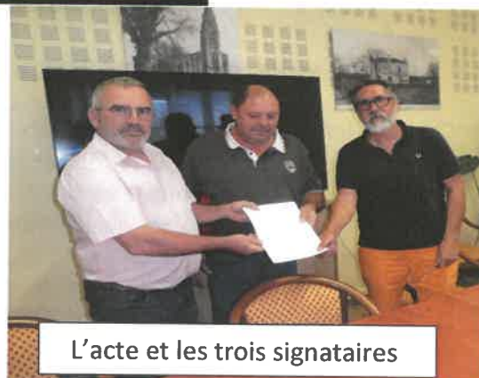
L'acte et les trois signataires

Cet échange fait suite au souhait de la commune de sécuriser l'accueil des enfants à l'école en permettant aux parents de se garer au plus près du bâtiment, sans qu'il n'y ait nécessité de traverser la route départementale, assez passante et donc potentiellement dangereuse.