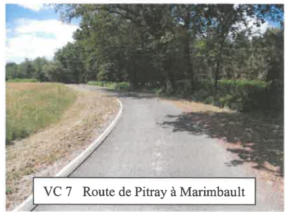
VC 7 Route de Pitray à Marimbault

À noter qu'en 2002 la Communauté de Communes de Villandraut qui venait de se créer a intégré l'entretien des voiries communales dans ses propres compétences, jusqu'en 2013, mais que la CdC de Langon a rendu cette compétence aux communes à partir de 2014, au prix d'une compensation financière de 11 000 €, très insuffisante pour couvrir les frais annuels réels d'entretien.