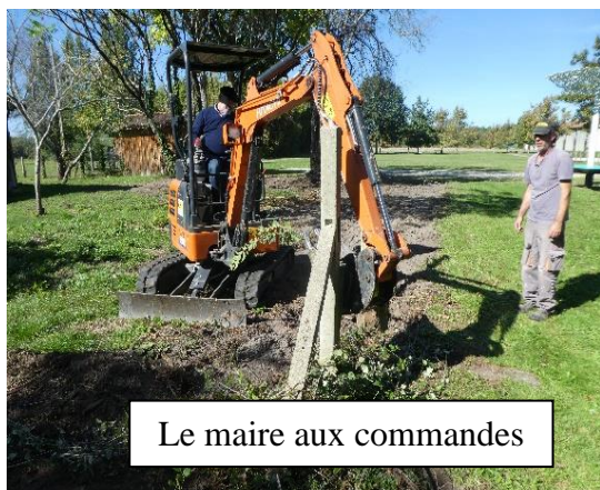
Le maire aux commandes

En matinée, le dessouchage a été réalisé par Christophe SPADETTO lui-même, et l'après-midi, pour l'enlèvement des poteaux de la clôture, la conduite de l'engin a été effectuée par Olivier DOUCE, maire de la commune, montrant à cette occasion une parfaite maîtrise.